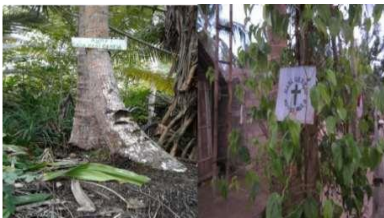
Gambar 2. Tanda pada pohon kelapa dan pohon Siro milik pribadi/keluarga yang di-Sasi

mengandung sekurangnya enam unsur pokok dalam pengelolaan wilayah pesisir, yaitu : 1) Batas Wilayah, yakni memiliki batas wilayah baik yang bersifat fisik (muara, sungai, pohon, gunung) maupun imajiner; 2) Aturan, yakni memiliki aturan operasional terkait dengan apa yang boleh dan apa yang tidak boleh dalam pemanfaatan sumber daya; 3) Hak, yakni mengatur hak para nelayan untuk mengelola maupun memanfaatkan sumber daya; 4) Pemegang otoritas, yakni dikelola oleh lembaga/ organisasi lokal yang umumnya tidak formal; 5) Sanksi, yakni mengatur sanksi bagi para pelanggar aturan yang umumnya berupa sanksi sosial dan ekonomi, dan kadang kala sanksi fisik; 6) Pemantauan dan Pengawasan, yakni mengatur aktivitas pemantauan dan pengawasan untuk memastikan aturan main dapat dilaksanakan. Berdasarkan itu, maka beberapa keunggulan dari LCBM ini, antara lain : 1) Tingginya rasa kepemilikan masyarakat terhadap sumber daya sehingga mendorong mereka untuk bertanggungjawab melaksanakan aturan tersebut; 2) Aturan-aturan yang diciptakan sesuai dengan realitas yang sebenarnya baik secara sosial maupun ekologis sehingga aturan dapat diterima dan dijalankan dengan baik oleh masyarakat itu sendiri; 3) Biaya transaksi rendah karena semua proses pengelolaan dilakukan oleh masyarakat itu sendiri, khususnya dalam kegiatan pengawasan.